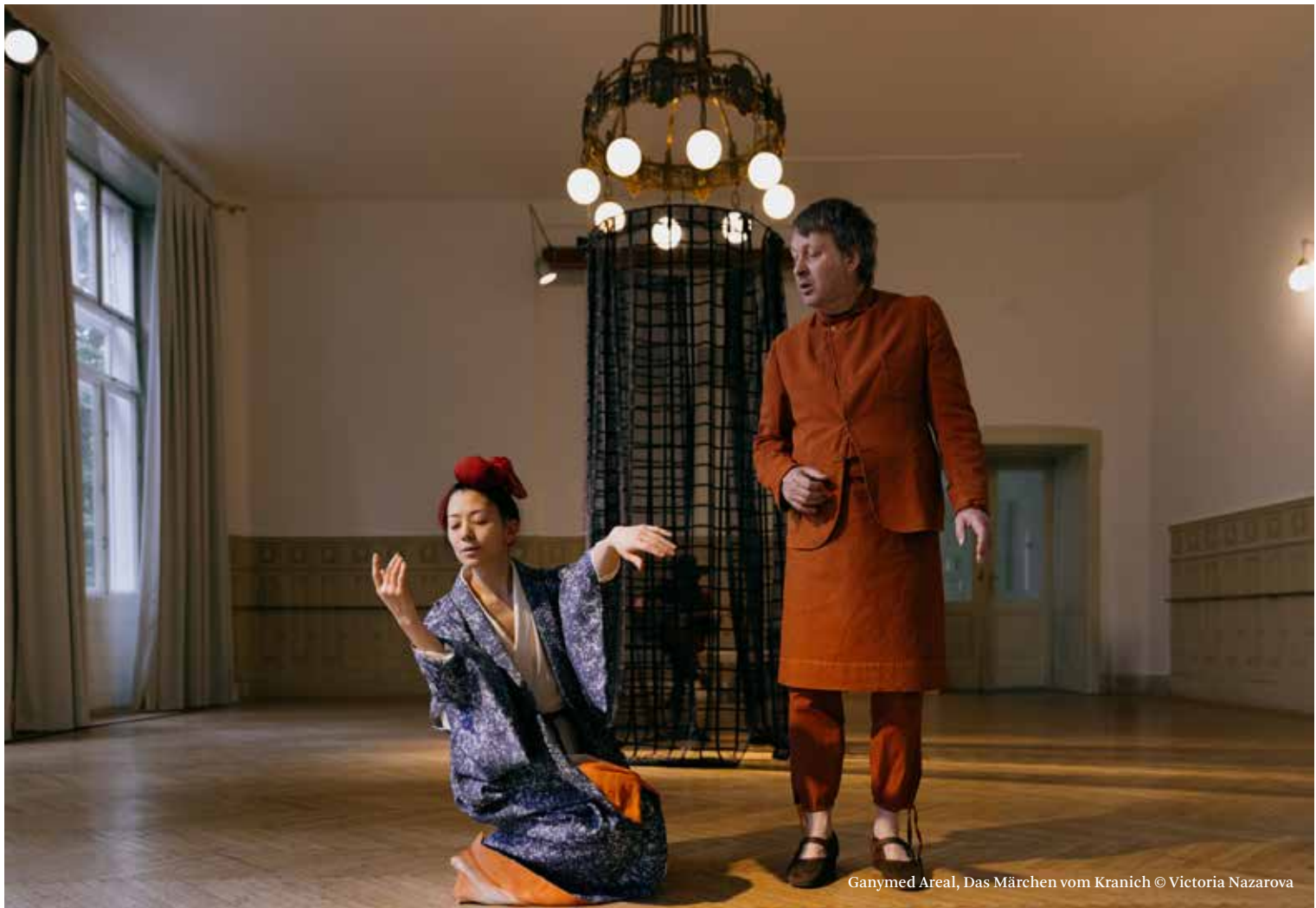
Ganymed Areal, Das Märchen vom Kranich © Victoria Nazarova