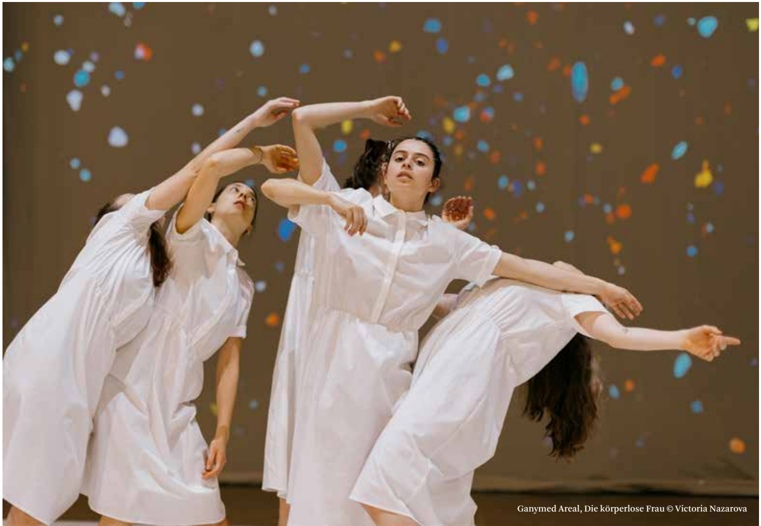
Ganymed Areal, Die körperlose Frau © Victoria Nazarova