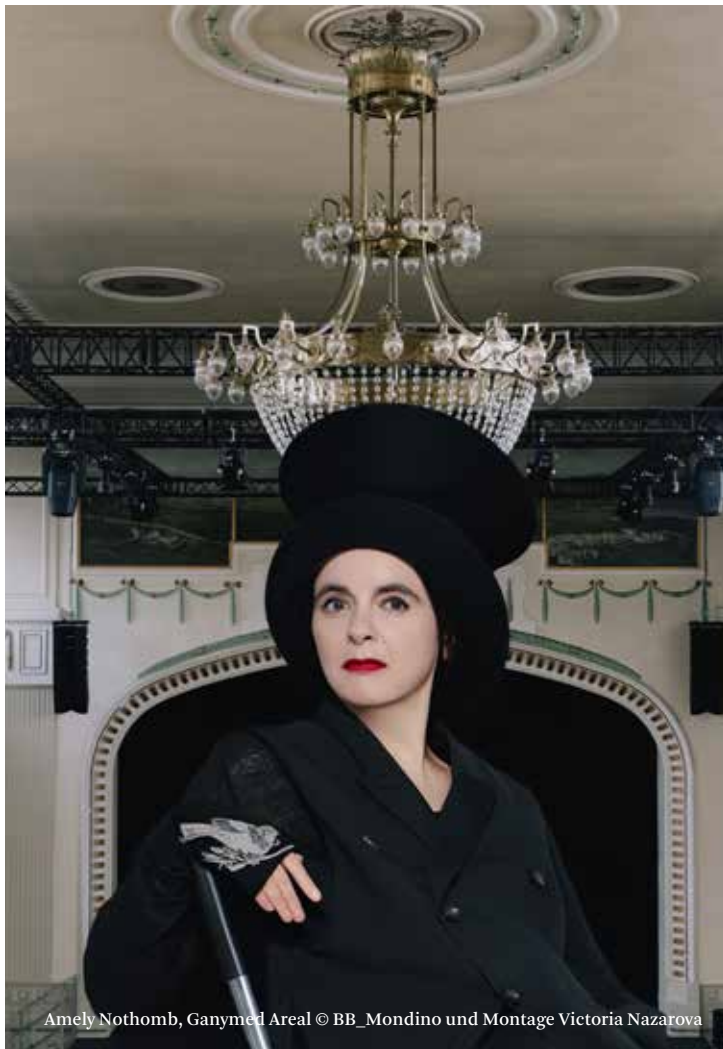
Amely Nothomb, Ganymed Areal © BB_Mondino und Montage Victoria Nazarova